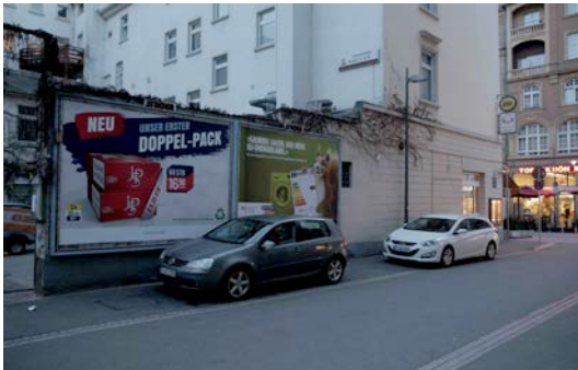
1 Fotografie in der Seite der Zeil 10 zur Seilerstrasse hin, quer gegenüber des Bürgeramtes - Undine