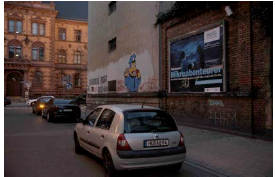
1 Fotografie in der kleinen Friedberger Strasse - Chará & Camille